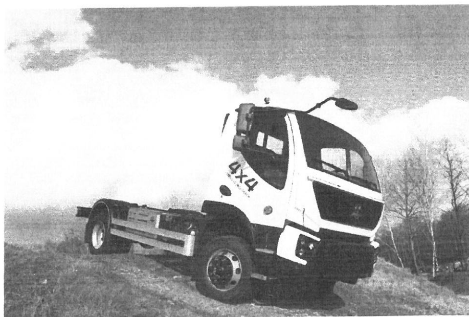
AVIA D120 4x4 – VOZIDLO S CELKOVOU HMOTNOSTÍ 12 000 KG